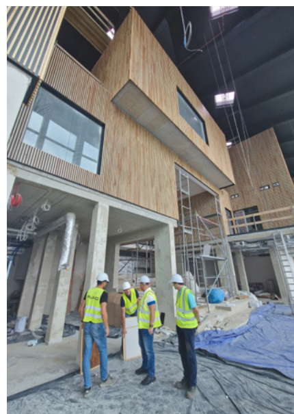
Wnętrze nowo powstałego budynku

Wykonawcą inwestycji jest spółka RUKO z Krakowa. Firma, zaraz po podpisaniu umowy wiosną 2023 roku, wzięła się do pracy. Budynek będzie gotowy już tej jesieni. Na budowę nowego gmachu, który wyborem mieszkańców nazwano „Manufaktura Trzebinia”, Gmina pozyskała aż 10 mln zł z Rządowego Funduszu Polski Ład.