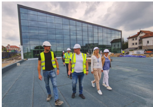
Oszklony obiekt stoi w centrum miasta

W nowym gmachu, poza biblioteką, mediateką, salą dla najmłodszych, mieścić się będzie sala konferencyjna oraz pomieszczenie, gdzie będzie można zorganizować różne uroczystości. Będą też miejsce wystaw, kawiarnia, biura. Jest też podziemny parking na 40 miejsc postojowych i dodatkowo parking zewnętrzny na 20 miejsc postojowych.