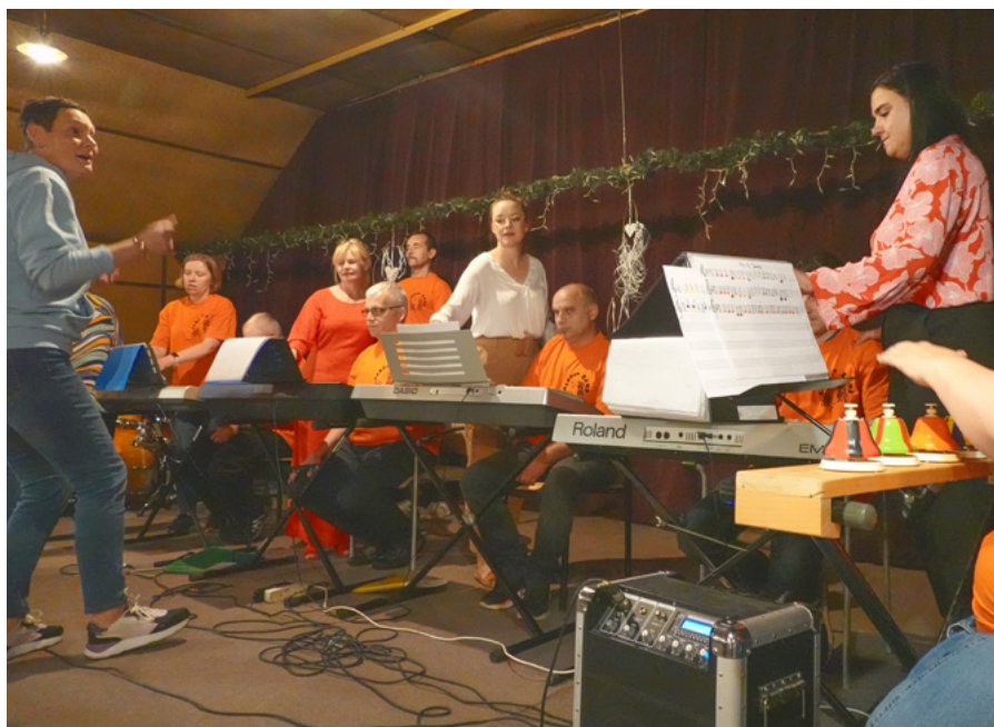
Występ zespołu Albert Band podczas 25. urodzin warsztatów

Z zajęć organizowanych przez WTZ korzysta 35 osób z niepełnosprawnościami. Do ich dyspozycji są pracownie terapeutyczne: gospodarstwa domowego, rzemiosł różnych, stolarska, krawiecko-dziewiąrska, plastyczna, ogrodnicza, organizowane są dla nich również zajęcia rehabilitacji ruchowej, a także muzyczne.