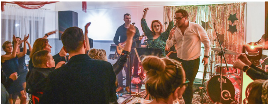
Charytatywny bal na osiedlu Siersza

Blisko 90 osób bawiło się na „Królewskim Balu Dobroci”, wyjątkowej imprezie zorganizowanej na osiedlu Siersza. Dochód z niej przekazano szkole. Zebrano sumę aż 14 342 zł.