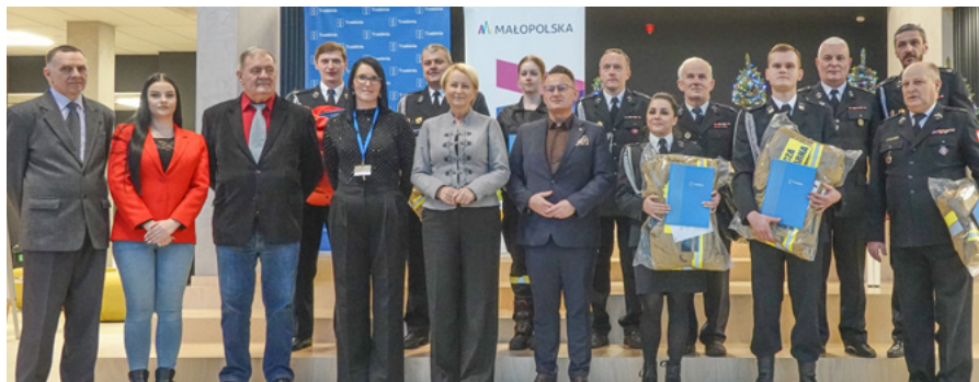
Zestawy otrzymali ochotnicy ze wszystkich jednostek OSP w gminie

Ochotnicy z dziewięciu gminnych jednostek OSP w gminie Trzebinia otrzymali zestawy specjalistycznej odzieży bojowej o wartości przeszło 40 tys. zł. Dodatkowo, strażacy z Myślachowic zyskali specjalne ubrania do ratownictwa wodnego.