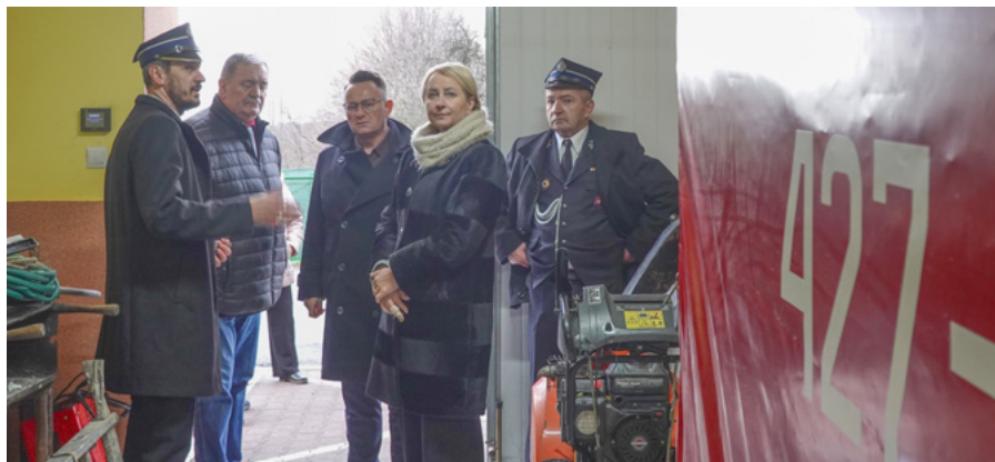
W uroczystym przekazaniu remizy uczestniczyła wicemarszałkini małopolski Iwona Gibas

Warunki pracy strażaków z OSP Płoki są coraz lepsze. Remizę docieplono, wykonano na budynku nową elewację, dodatkowo w miejscu, gdzie wcześniej było okno, zamontowano drzwi, poprawiając komunikację.